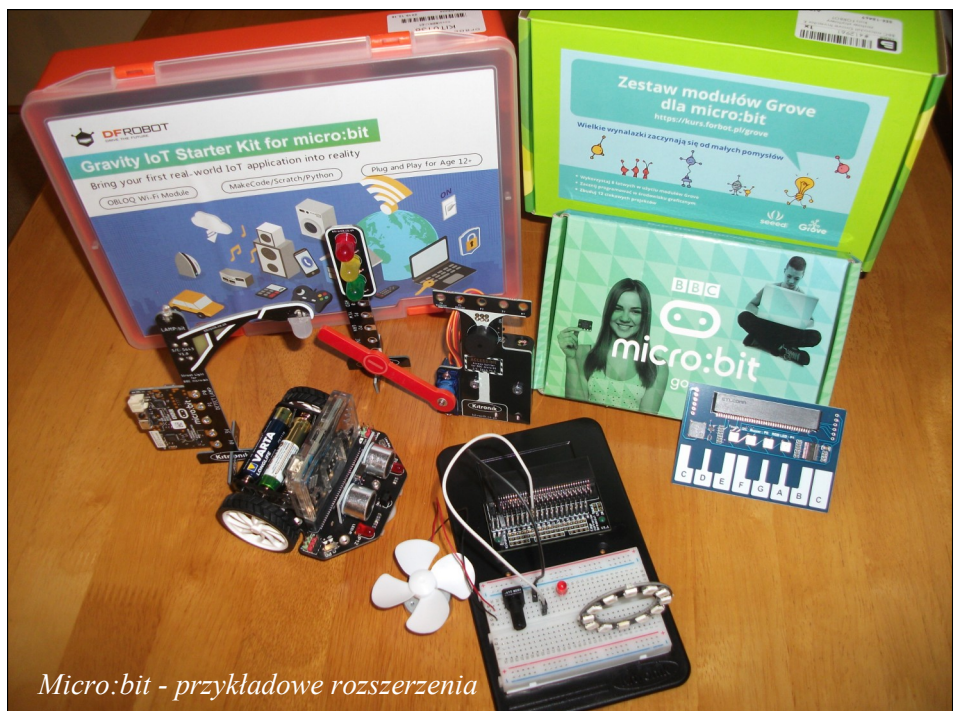
Micro:bit - przykładowe rozszerzenia

Opracował: Sławomir Bester Wicedyrektor szkoły