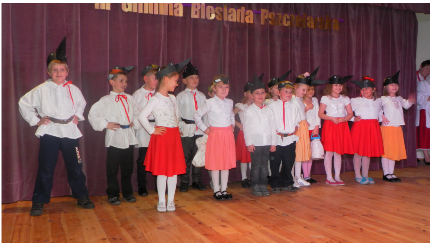
Występ średniej grupy wiekowej zespołu tanecznego „Brzózanka”