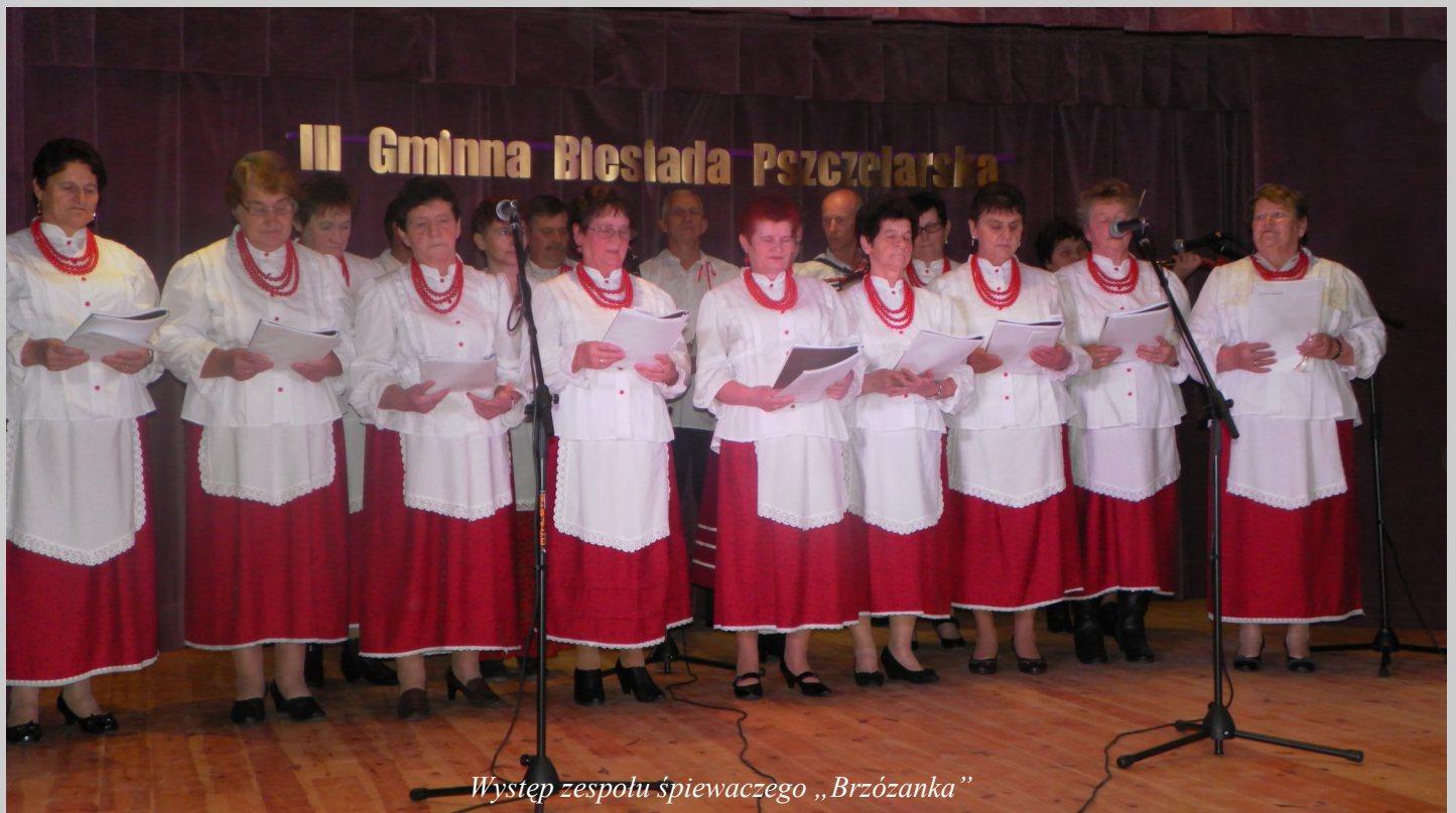
Występ zespołu śpiewaczego „Brzózanka”

W drugiej części zespół „Grodziszczoki” z Grodziska Dolnego pokazał widowisko obrzędowe „Miodobranie”. Wspaniała gra aktorów, żywiołowy taniec przy dźwiękach skocznej muzyki robił ogromne wrażenie na widowni. Tradycja bartnictwa, obrzęd wybierania miodu,