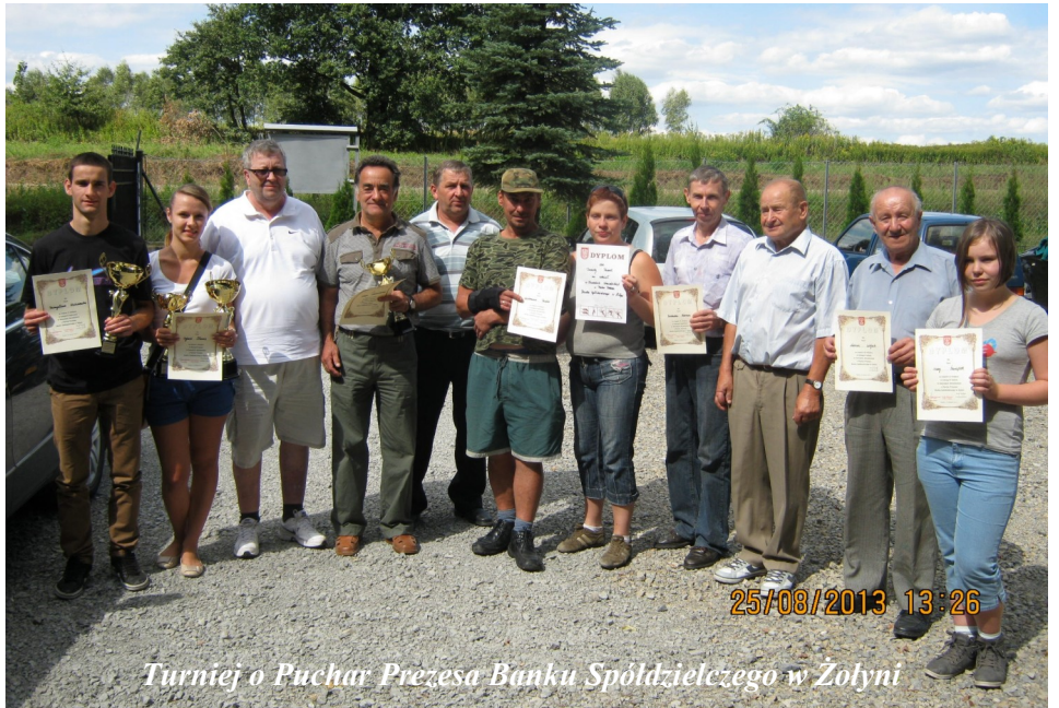
Turniej o Puchar Prezesa Banku Spółdzielczego w Żołyńni