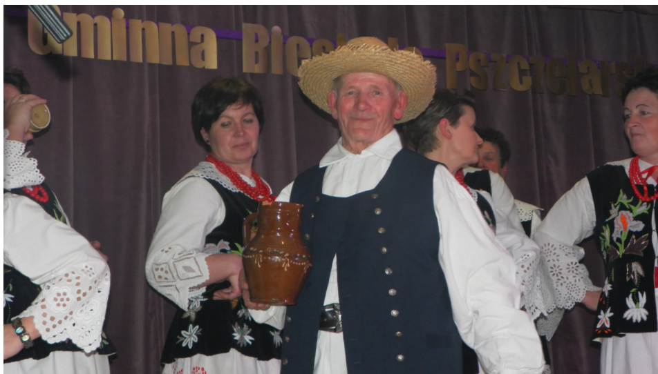
Na zdjęciach fragmenty widowiska obrzędowego „Miodobranie” w wykonaniu zespołu Grodziszczoki

targowanie przy zakupie miodu na wesele śpiew i taniec był wspaniałym zakończeniem wieczoru.