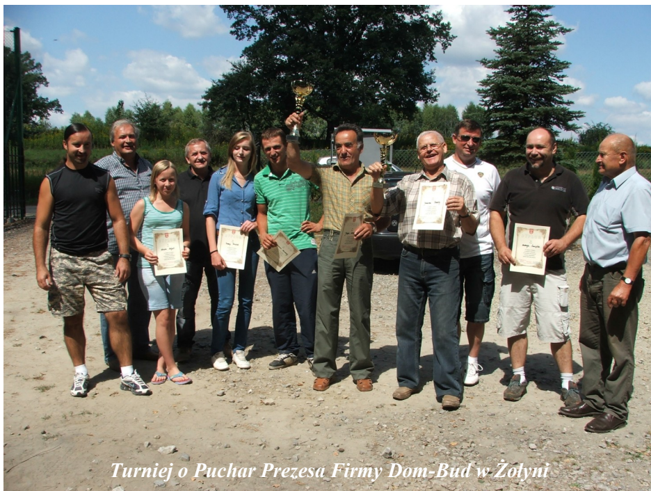
Turniej o Puchar Prezesa Firmy Dom-Bud w Żołyńi