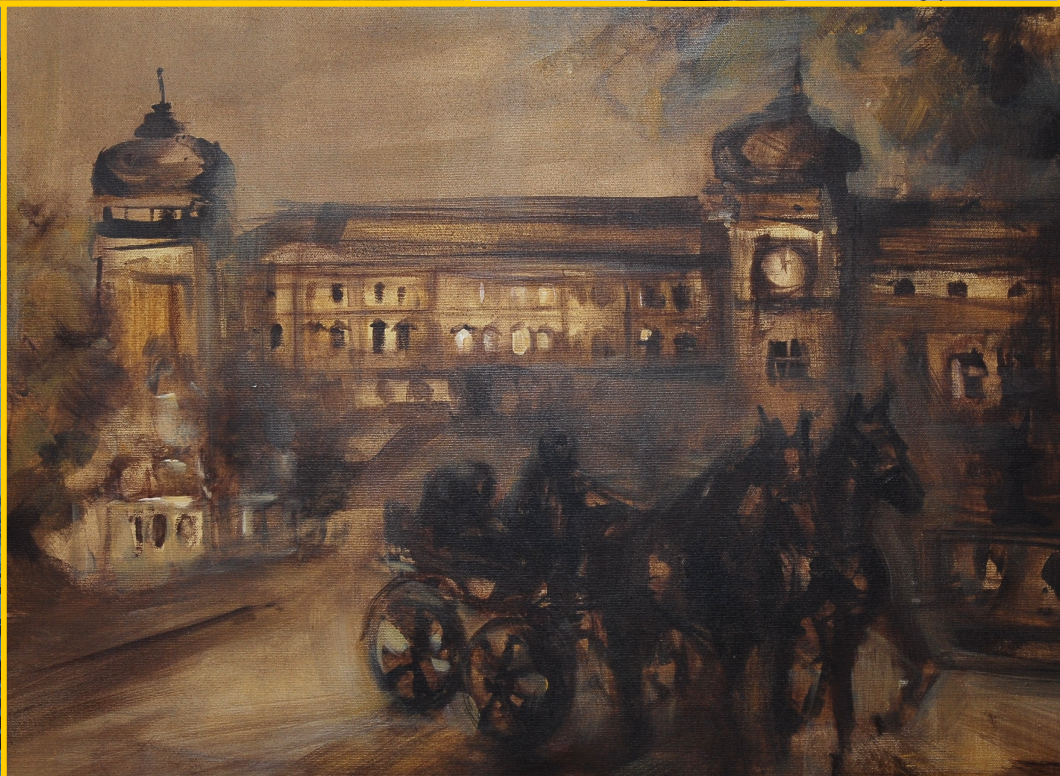
Artystyczne impresje w GOK w Żołyni, czyt. str. 10